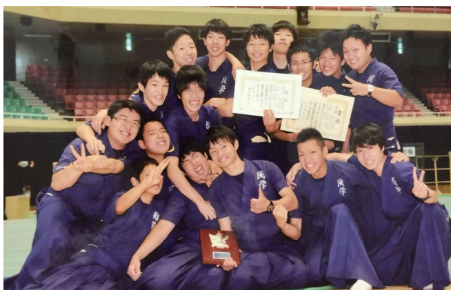
弓道部時代 全日本学生弓道選手権大会 準優勝時