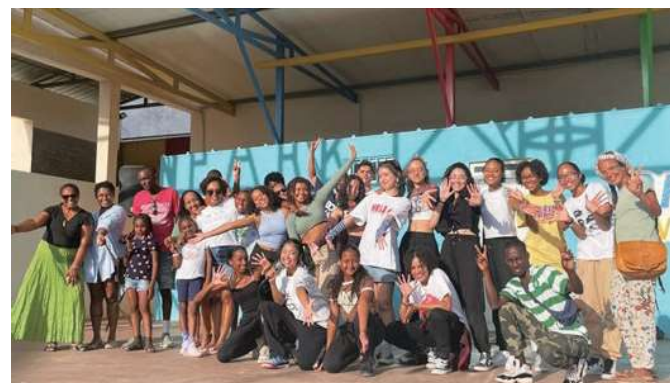
NAOKA設立のダンススタジオの生徒たちとその保護者。 イベントを現地の遊園地でやり終えて、みな充実の表情