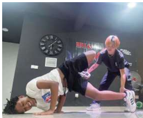
楽しくびしくレッスン