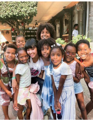
カーボベルデの子どもたちと笑顔で

私は、ヨーロッパの世界大会でのタイトル獲得という最大の実績を得ようと、そのトレーニング場所を探していました。ヒップホップのルーツである黒人の人々の視点にたつぷり触れられて、ヨーロッパへのアクセスが良いところであれば、どこでもよかったです。そんな中、見つけた国がアフリカのカーボベルデ共和国。「米文化・治安がまだいい・年中気候が良い・大好物のマグロの名産地」という4つの特徴が決めてになりました。実際に来てから半年間この国のダンス文化に触れてみると、ヒップホップに関してはかなり後進国であることがわかりました。そこで自分のトレーニ