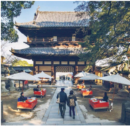
境内の中で飴を販売する五人百姓

五人百姓とは、金刀比羅宮の御祭神にお供してきた5軒の家筋のことです。「百姓」には「神事の百の何でもできる人」という意味が込められており、先祖代々数千年の間、神事のお手伝いを続けてきたことから境内で唯一商売を許可され、ご利益飴である「加美代